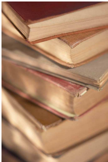
La thèse de maîtrise de la théorie de la société civile

Les peuples du monde doivent cultiver leurs racines communes, ce qui forme un grand tronc commun de l'humanité, ce qui permet de soutenir les branches plurielles de nos cultures.