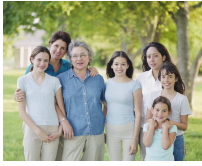
Une photo de famille