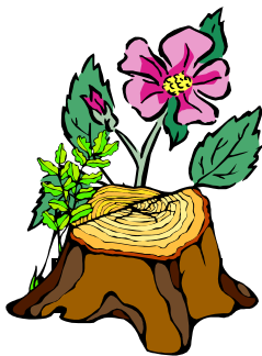
Des fleurs qui poussent dans le bois mort

Il nous faut domestiquer l'État, mais sans la violence !