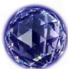
Un bibelot en cristal appartenant à ma mère