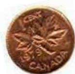
Un sou noir qui a eu la vie dure !

Aider à la création d'une coopérative de commerce équitable. Pour que nos échanges et nos milieux de travail soient coopératifs et démocratiques.