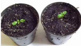
Des graines plantées dans la terre

Lorsque les gens me voient avec ce ski-balai, en train de nettoyer la rue bénévolement, j'ai l'air bizarre, mais j'interpelle au changement !