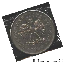
Une pièce de monnaie polonaise