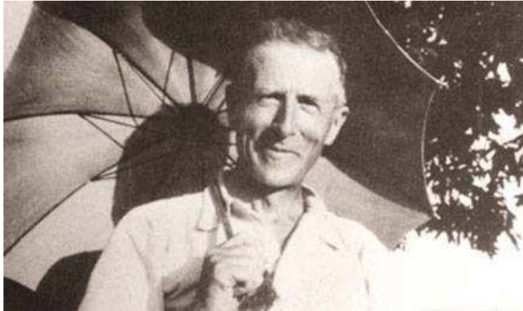
Pierre Teilhard de Chardin

« Dieu est présent dans la pierre, il rêve dans les fleurs, s'éveille dans les animaux, est conscient dans l'homme et sent qu'il est conscient chez la femme. »